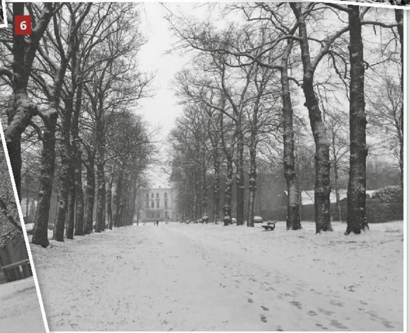
1: Leen Meheus 2: Aline 3: Erna De Maeyer